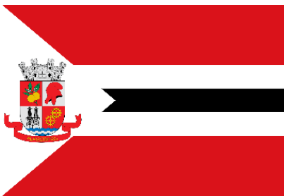
Bandeira Município de Alagoins