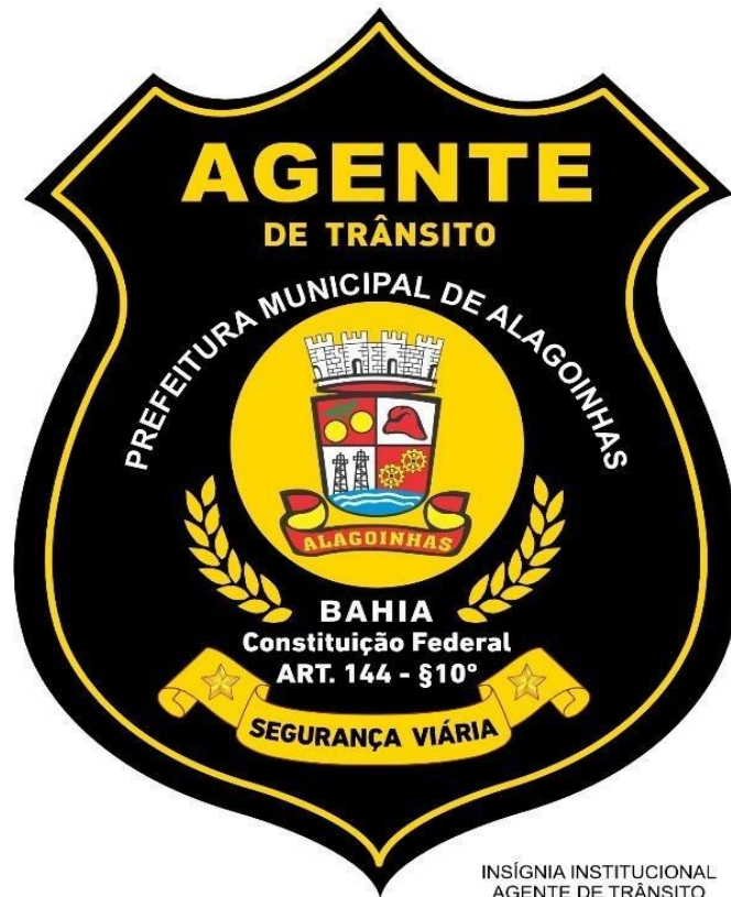
INSÍGNIA INSTITUCIONAL AGENTE DE TRÂNSITO