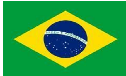
Bandeira do Brasil