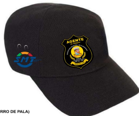
GORRO DE PALA)